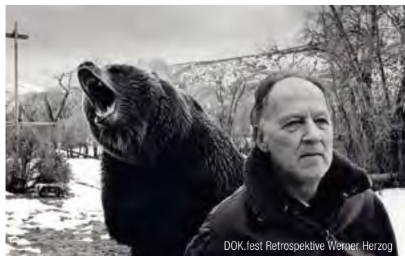
DOK.fest Retrospektive Werner Herzog

Der Wettbewerb für Filme aus Ländern mit instabilen Strukturen. (Preisstifter ARTE, dotiert 3.000 €)